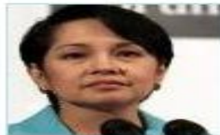
Gloria Macapagal- Arroyo