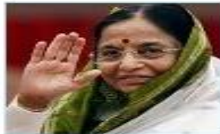
Pratibha Patil India