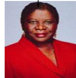
Luísa Días Diogo