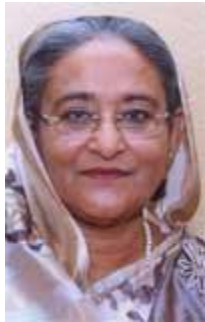
Sheikh Hasina Wajed