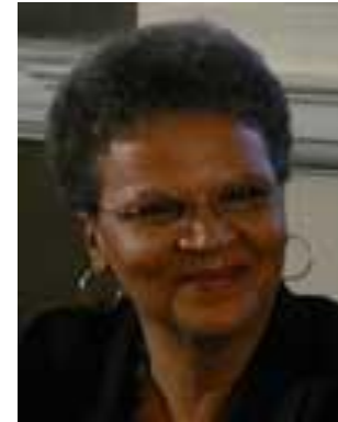
Michèle Pierre- Louis