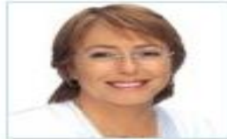
Michelle Bachelet Jeria Chile