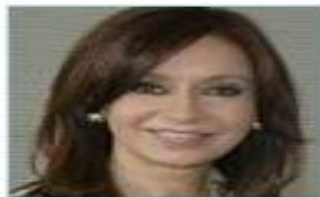
Cristina Fernández de Kirchner Argentina